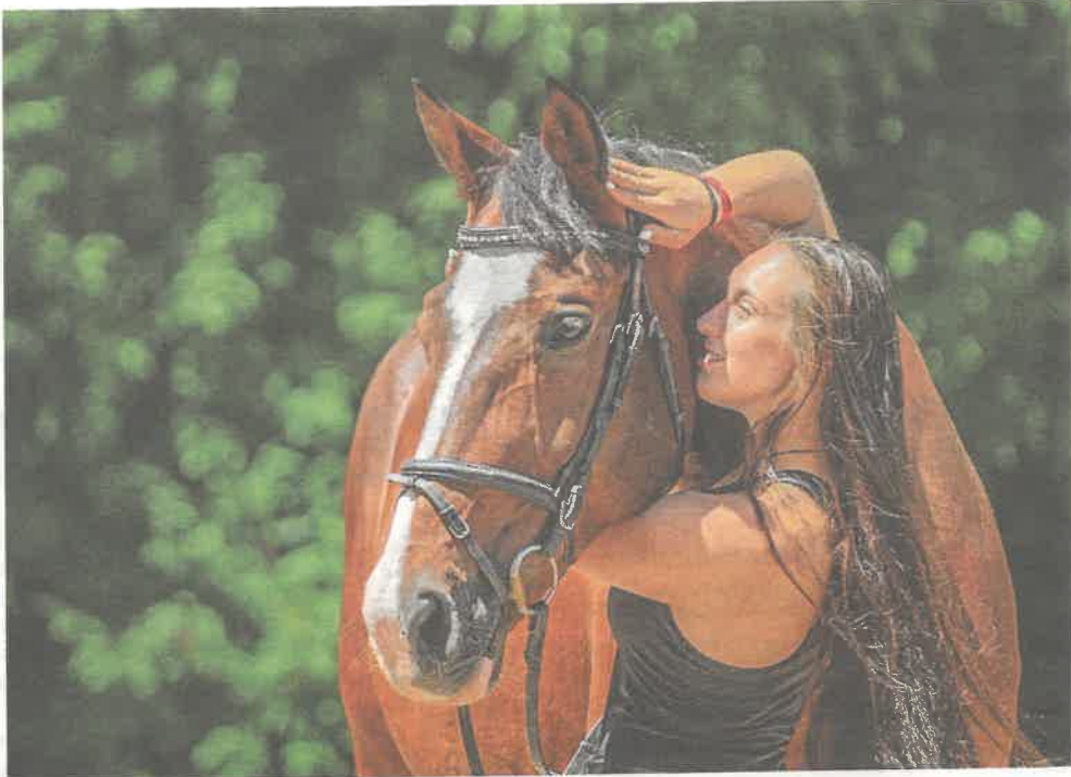
S LÁSKOU KE KONĚM CHOVATELSTVÍ SE ZAMĚŘENÍM NA DOSTIHOVÝ SPORT A DALŠÍ PŘÍBUZNÉ OBORY LZE STUDOVAT NA STŘEDNÍ ŠKOLE DOSTIHOVÉHO SPORTU A JEZDECTVÍ V PRAZE – VELKÉ CHUCHLI. PŘIROZENÉ JE, ŽE TAM STUDENTI NESEDÍ JEN V LAVICÍCH, ALE TAKÉ V SEDLECH.

Škola z Velké Chuchle je také zapojena do seriálu parkurových závodů mezi zemědělskými školami – Ligy zemědělských škol. Žáci oboru chovatelství absolvují praxi nejen ve školních stájích, ale i ve sportovních střediscích v Trnové u