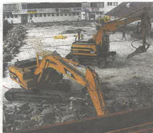
KDO JE SEŘÍDÍ? OBOR STROJNÍK STAVEBNÍCH STROJŮ VYUČUJE JEDINÁ ŠKOLA V ČESKÉ REPUBLICĚ, AKADEMIE ŘEMESEL PRAHA.

Koně pod kapotou ale nejsou pro každého. Střední škola dostihového sportu a jezdectví nabízí příležitost pro milovníky opravdových koní – z jejich koníčka se může stát skutečná profese. Jezdec a chovatel koní se zaměřením na dostihový sport je tříletý obor zakončený závěrečnou zkouškou s výučním listem. Žáci se připravují pro kvalifikované práce v chovu koní s důrazem na ošetřování všech kategorií koní i jízdu na těch dostihových či sportovních. Součástí studia je absolvování cvalových i klusáckých dostihů, parkurových soutěží a stáží ve významných chovatelských, tréninkových a dostihových centrech po celé České republice i v zahraničí.